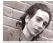
الشهيد أحمد الخطيب