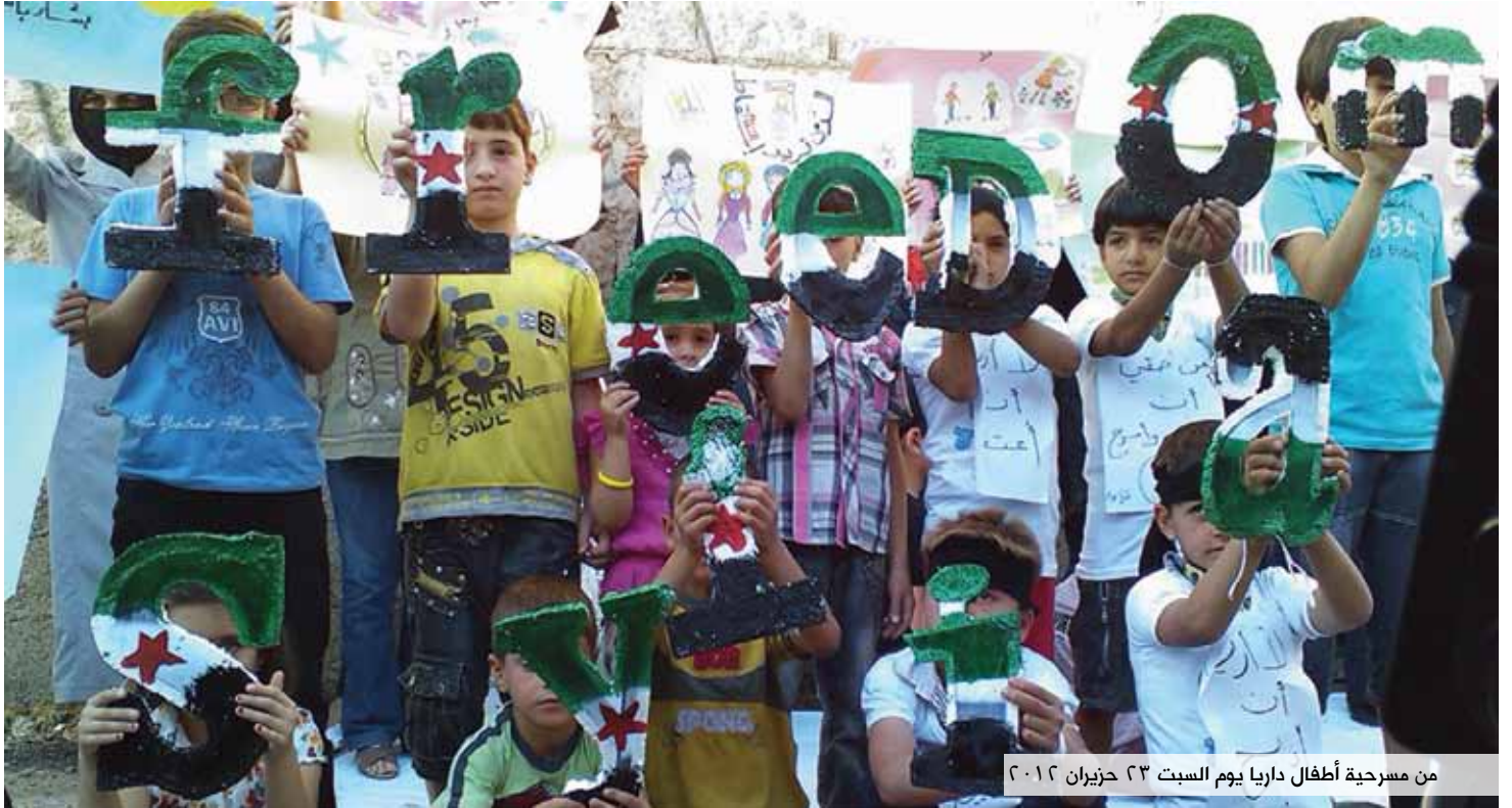
من مسرحية أطفال داريا يوم السبت ٢٣ حزيران ٢٠١٢