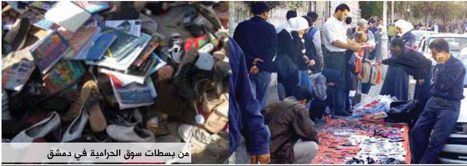
من بسطات سوق الحرامية في دمشق

لذلك يسعى التي قلما يتجاوز عدد العاملين فيها العشرة عمال. وبذلك فإن قرار صناعي واحد بالوقوف النظام إلى ضمان ولاء القطاع الصناعي واستمرار دعمه للنظام وتمويله. فالصناعي صاحب المنشأة يشغل عددًا كبيرًا من العمال يتراوح بين بضع عشرات وبضعة آلاف، بخلاف المنشآت والمحال التجارية مع النظام ودعمه ومنع عماله من المشاركة في أي من مظاهر الحراك الثوري، وإلا كان الفصل من العمل وقطع الرزق بالانتظار، سيكون له تأثير كبير على الحراك المجتمعي نتيجة العدد الكبير من العاملين لدى هذا الصناعي. وهذا ما بدا واضحًا في موقف - كثير